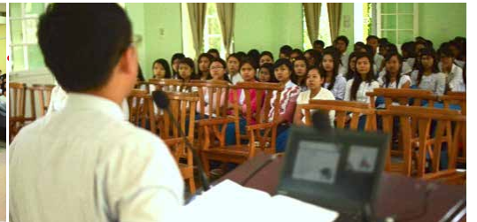
5月26日 ヤンゴンコンピュータ大学にて