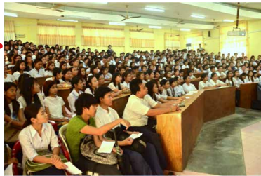
5月27日 西ヤンゴン技術大学にて

第3回セミナーでは、ミャンマーの大学を卒業し、日本・シンガポール等海外での業務経験のある卒業者が壇上に立ち、これから働く学生らへ働くことについての楽しさや難しさ、やりがい等、先輩方の経験を通じてアドバイスを送った。学生達からもOBという身近な存在の話聞き、多くの質問の手が挙がった。働くこと・キャリア形成についてイメージを抱く事も難しい大学生のキャリア形成、将来の飛躍の助けとなるべく、長期にわたるミャンマー全体の労働力の底上げを目的とし、今後も継続してセミナーを実施していく。